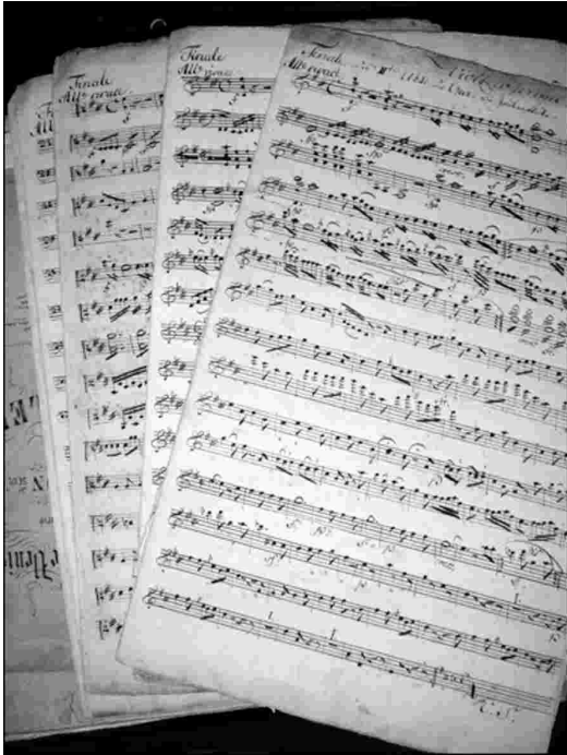
Partitura original del "Don Giovanni"