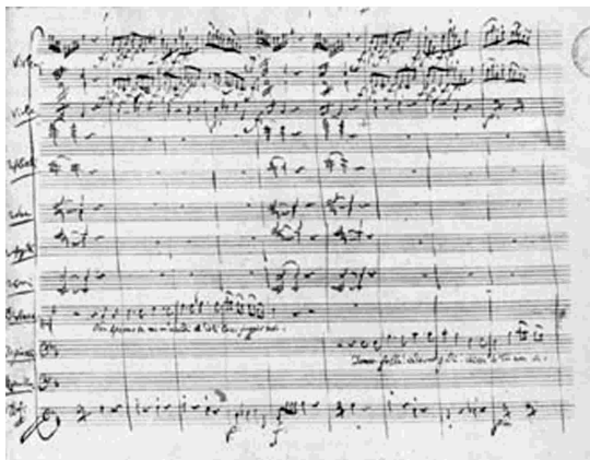
Partitura de "Don Giovanni" manuscrita por el propio Mozart